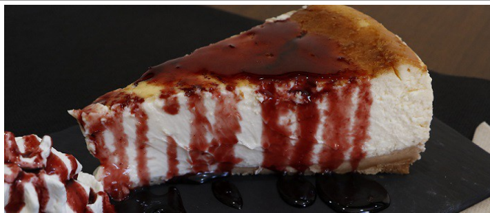
Tarta de formatge 4,00 €