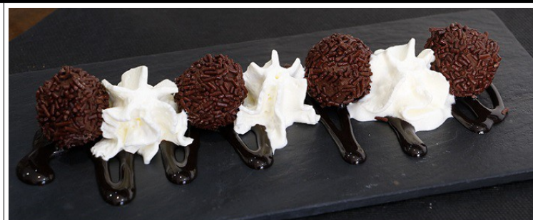
Trufes de xocolata 5,50 €