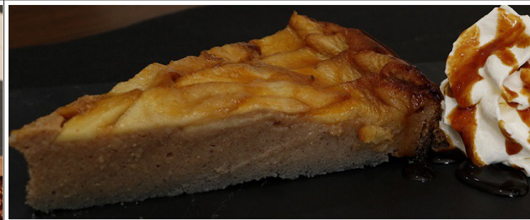
Pastís de poma 3,50 €