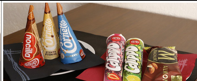
Gelats 2,90 €