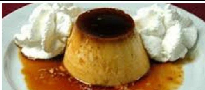
Flam amb nata 3,00 €