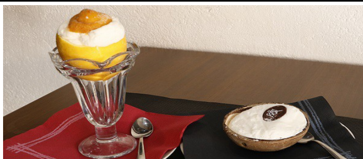
Coco / Llimona gelats 5,50 €