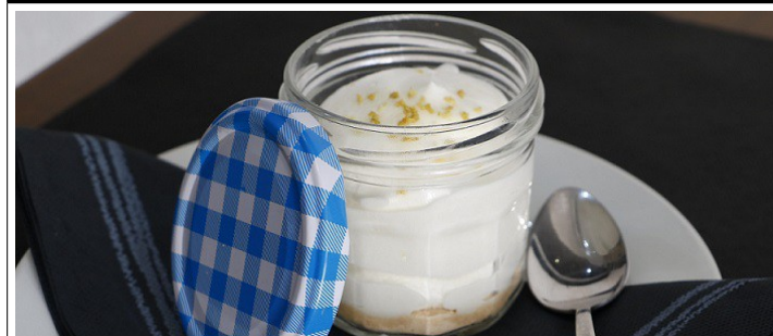
Mouse de llimona / xocolata 3,00 €