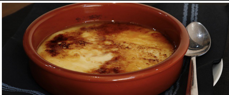
Crema catalana 4,50 € (Tardor i Hivern)