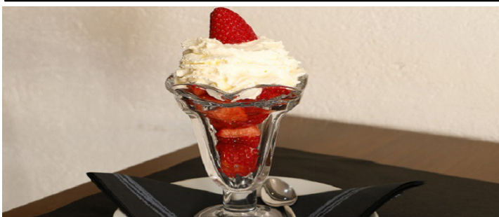
Maduixes amb nata 4,50 € (Hivern i Primavera)