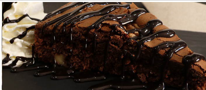
Brownie 3,50 €